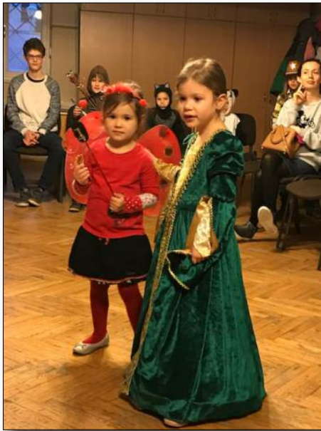
Képek a schola farsangról