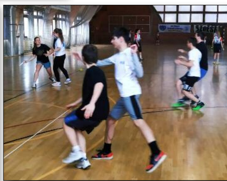
Ministránsaink a frizbi versenyen