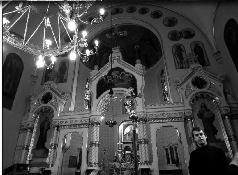
A gyönyörű görögkatolikus templom