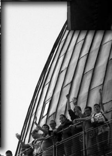
Esztergomi ministráns találkozó