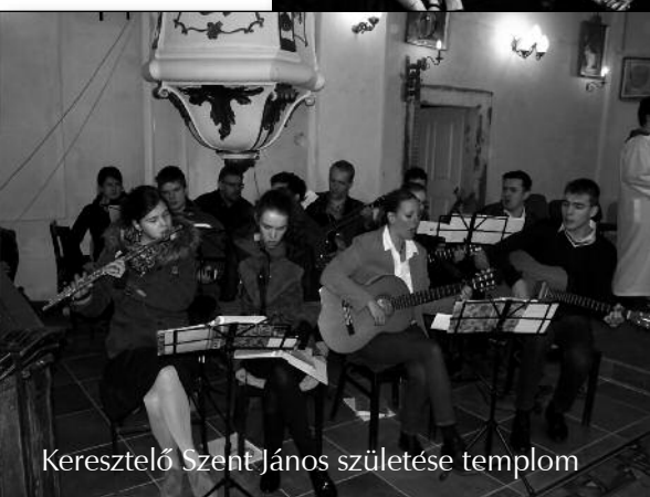
Keresztelő Szent János születése templom