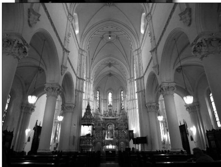
Májusban Kőbányán, a Szent László templomban járt az Ismerd+