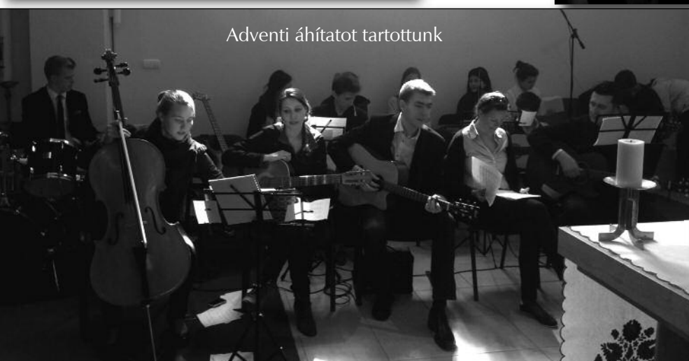
Adventi áhítatot tartottunk