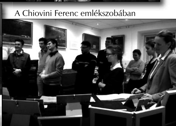
A Chiovini Ferenc emlékszobában