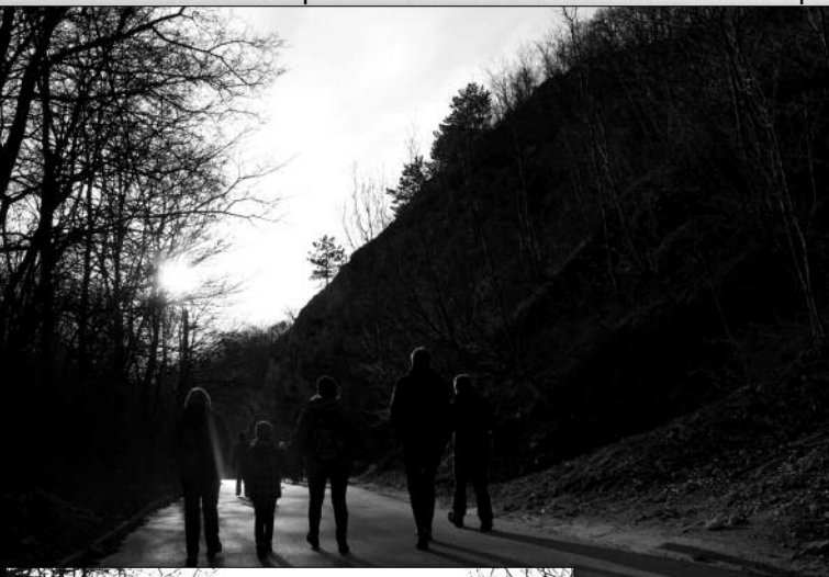
Napkelte váró szentmise húsvét vasárnap az Uti Madonna kápolnánál