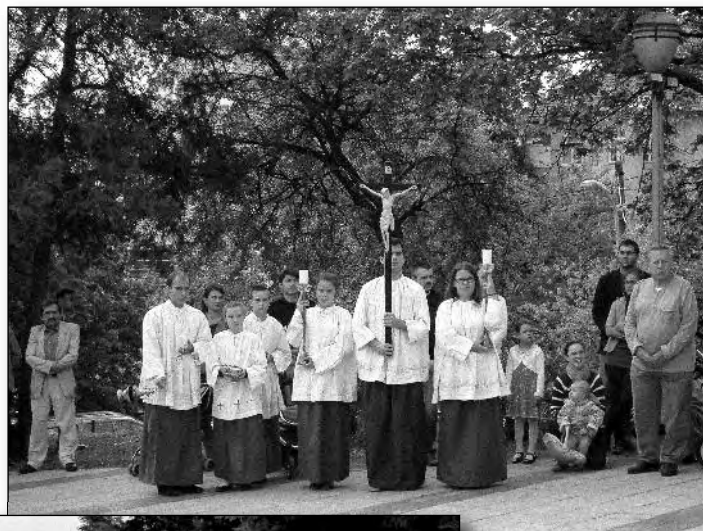
Képek a templom megáldásáról.