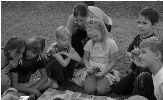
A gyerekek programon kevesen voltak, de jól szórakoztak