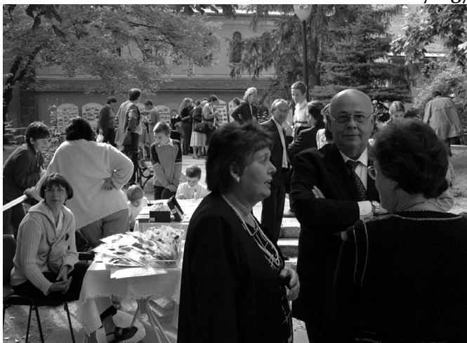
Agapé és kirakodó vásár a templomkertben