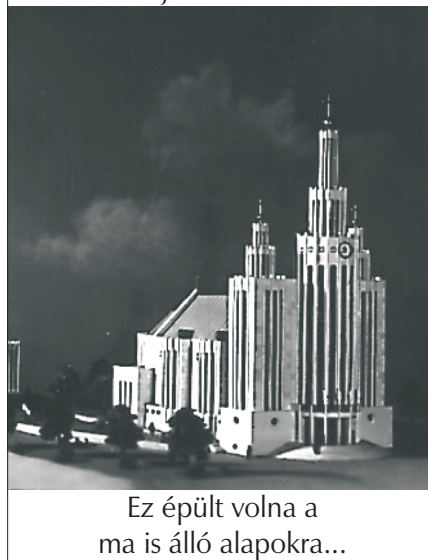
Ez épült volna a ma is álló alapokra...

A múlt évben a képviselő-testület építészei elkészítették kis templomunk bővítésének látványtervét. Az oltár mögötti részt kereszthajóként lehetne kiszélesíteni, a sekrestyét áthelyezve, mellette közösségi ház épülhetne. A hívek templomfelújításra szánt havonkénti adományaiból 3 millió forint gyűlt össze az egyházközség külön számláján.