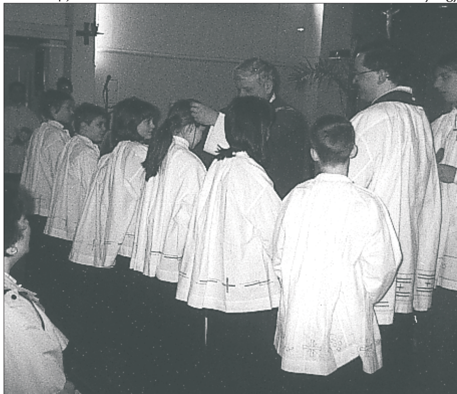
Az idei ministránsavatás