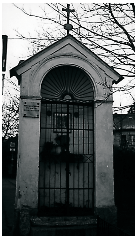
Szent Márton, könyörögi érettünk!

Menjünk el szavazni, s beszéljük rá a bizonytalankodókat is. Hiszen most dől el, hogy az ezredfordulón, Szent István trónra lépésének millenniumán és Krisztus születésének 2000. évfordulóján lesz e keresztény szellemiségű, vagyis emberközpontú politizálás ebben az országban, vagy a totális diktatúra marxista, nemzetietlen évtizedei után hosszú távra berendezkedhetünk a totális kapitalizmus szintén nemzetietlen és embertelen világára.