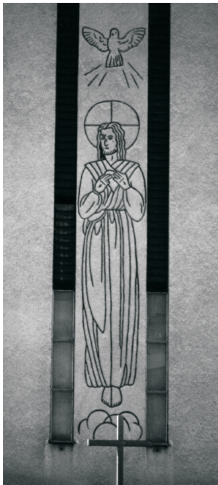
Jézus szíve ábrázolás a templom homlokzatán

A nagy ünnepeknek ő is örült. Ilyenkor nemcsak több pezsgős meg boros üveg volt a kukában, no meg több félig elhasznált cipő, de megsokszorozódtak a kidobott hűtőszekrény-, meg tévé-kartondobozok is: jelül annak, hogy a karácsony jelentős esemény a