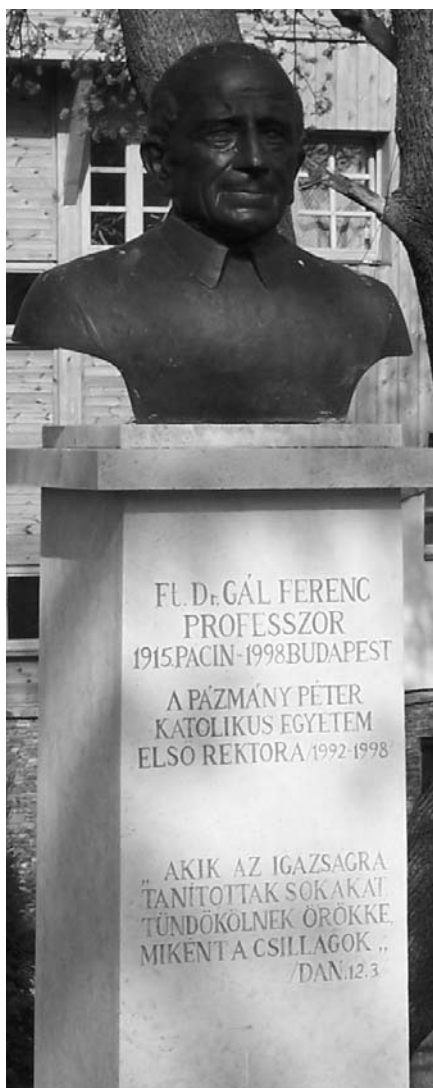
Az egyetemalapító szobra Píliszabán